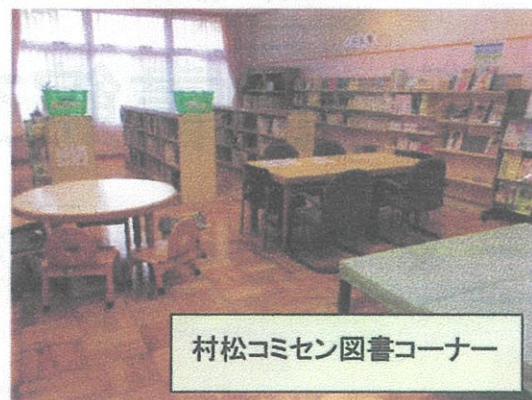
村松コミセン図書コーナー