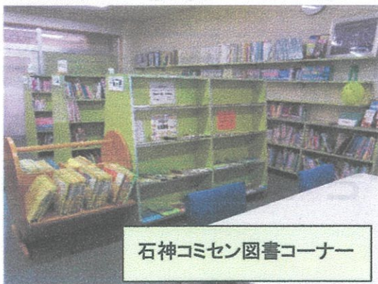
石神コミセン図書コーナー